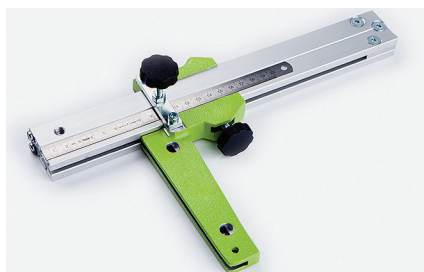
Полосорез Позволяет нарезать полосы заданной ширины.