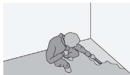
Рис. 21. Выравнивание оснований

Шпаклевочные массы необходимо шлифовать после высыхания и перед укладкой чистить пылесосом. Воздушные пузыри или попавшие комки, возникшие при размешивании или при работе мастерком, хорошо видны. Шлифовать необходимо по всей поверхности, включая труднодоступные места в углах, проемах и около стен.