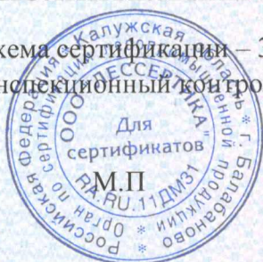
Схема сертификации – Зс. Инспекционный контроль – октябрь 2021 года, октябрь 2022 года.