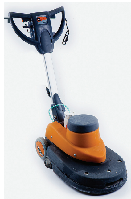
Шлифовальная машина Для шлифовки основания.