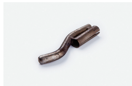
Ремонтная насадка Для обработки шнура в углах.