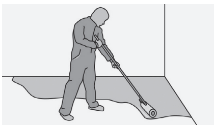
Рис. 20. Грунтование стяжки

Грунтовка и ровнитель – один производитель.