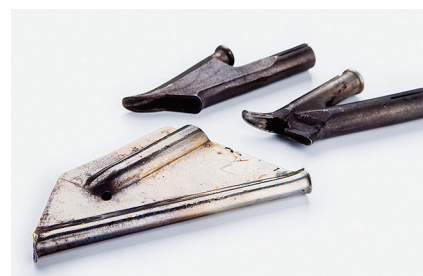
Насадка 5 мм зауженная Для сварки ПВХ покрытий.