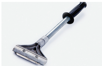
Скрепер Для удаления старого клея и загрязнений с основания.