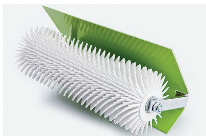
Игольчатый валик Для удаления пузырьков воздуха из нивелирующего слоя после выравнивания.