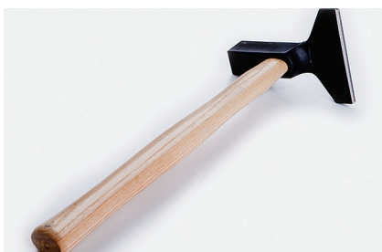
Кромковтирочный молоток, цельнокованный Используется для выдавливания воздушных пузырей и лучшего приклеивания покрытия. Особенно полезен рядом со стенами и на стыках.