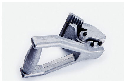
Инструмент для удаления старых покрытий