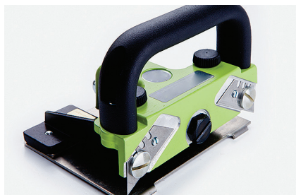
Линокат Для подрезки краев материала.