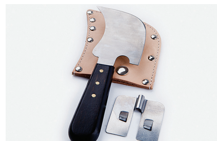
Месяцевидный нож с насадкой Используется для подрезки сварочного шнура. Насадка позволяет осуществлять предварительное обрезание сварочного шнура, защищая напольное покрытие.