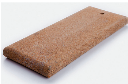
Пробковая доска Используется для выдавливания воздушных пузырей и лучшего приклеивания покрытия.