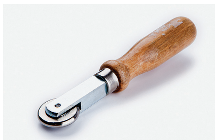
Прикаточный ролик Используется при работе в углах.