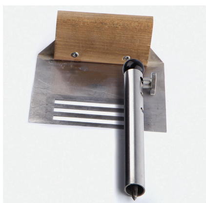
Рис. 12. Прибор Ri-Ri