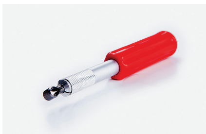
Резак для подрезания с обратной стороны Позволяет подрезать сварочный шнур в углах.