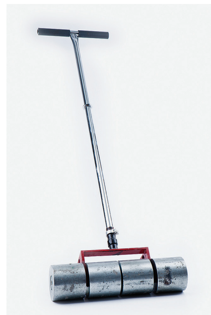
Прикаточные вальцы 50-75 кг Для прикатывания ПВХ на больших площадях.