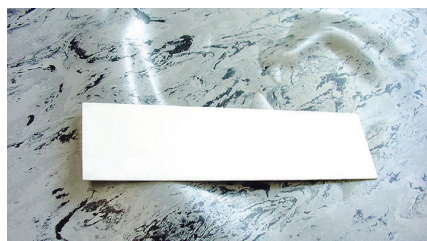
Рис. 11. Образование пузырей при несоблюдении требований по укладке