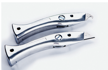
Нож «Дельфин» Для резки эластичных напольных покрытий.